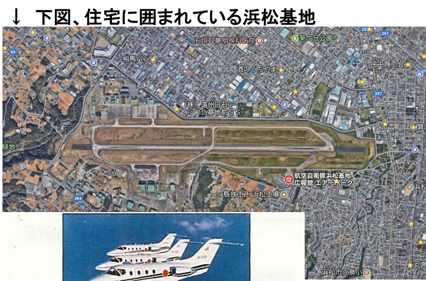
↓ 下図、住宅に囲まれている浜松基地